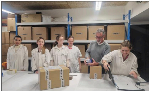
Le taux d'erreurs sur les commandes est deux fois inférieur à l'IME que dans des boîtes privées.