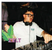
La Baronne Festival, dimanche 15 septembre.

Entrez dans l'univers enchanteur de La Baronne, un festival où se mêlent la musique électronique et l'art du spectacle dans un lieu historique, celui du château de La Napoule ! Une expérience décalée, rêveuse, créative et pleine d'amour ! « Plus qu'un simple événement, ce festival est un refuge pour les âmes en quête de liberté, de connexion et d'émerveillement », raconte l'agence